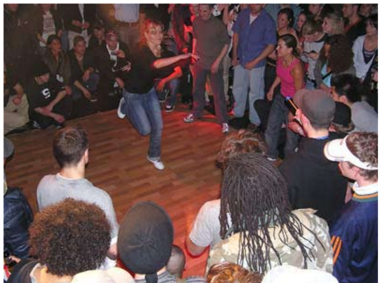
Breakdance beim 2. HipHop Kongress